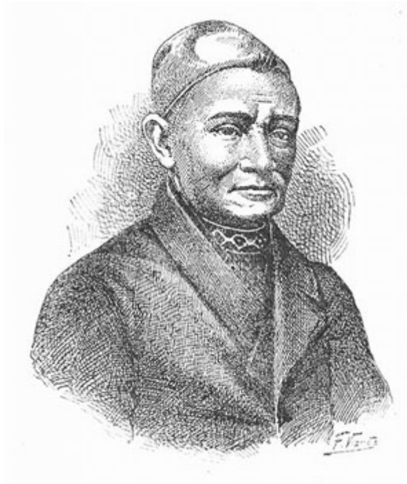
Doctor don Francisco de P. González Vigil