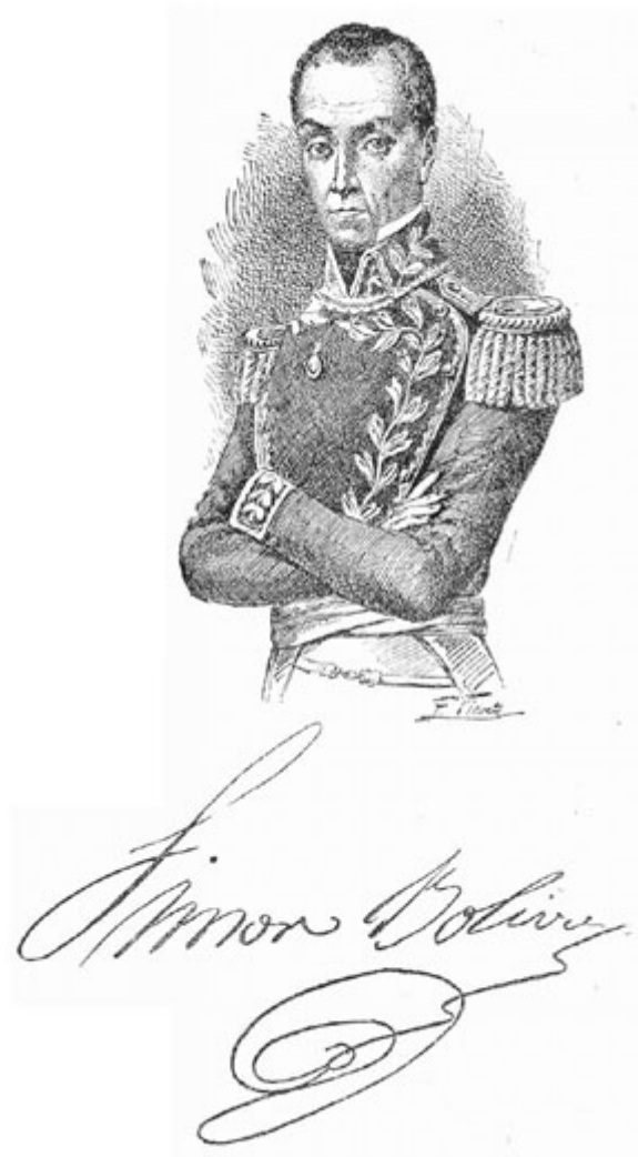
El Libertador don Simón Bolívar

No podré precisar la fecha en que rota la armonía del matrimonio, por motivos que no me he empeñado en averiguar, regresó doña Manuela a Quito; pero debió ser a fines de 1822; pues entre las ciento doce caballeras de la Orden del Sol, figura la señora Sáenz de Thorne, que indudablemente fue una de las más exaltadas patriotas.